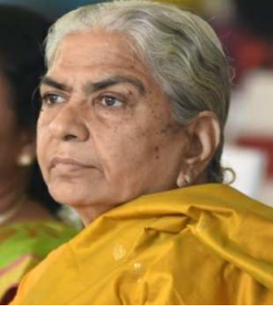
மகள் திருமதி கஸ்தூரி